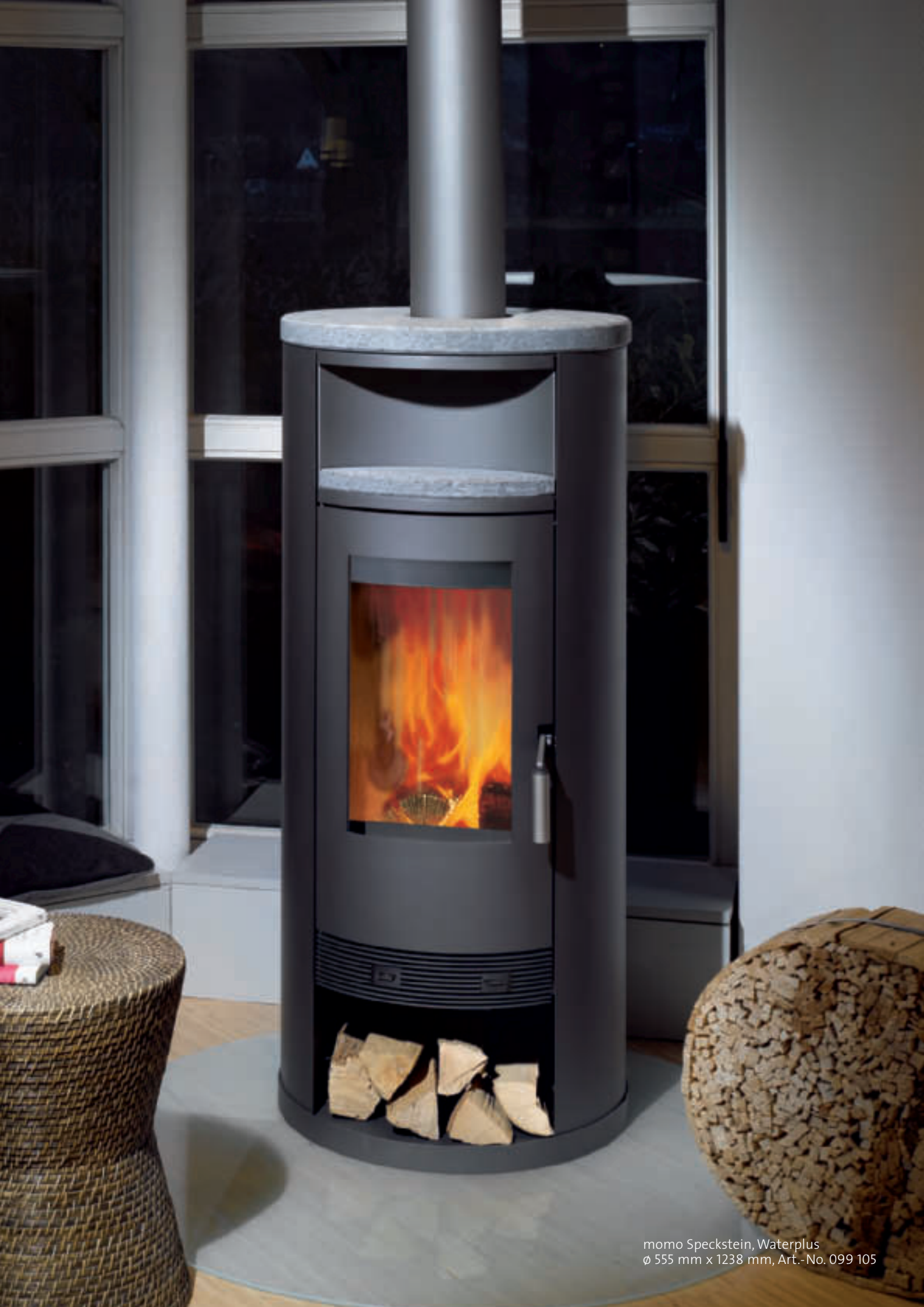
momo Speckstein, Waterplus ø 555 mm x 1238 mm, Art.-No. 099 105