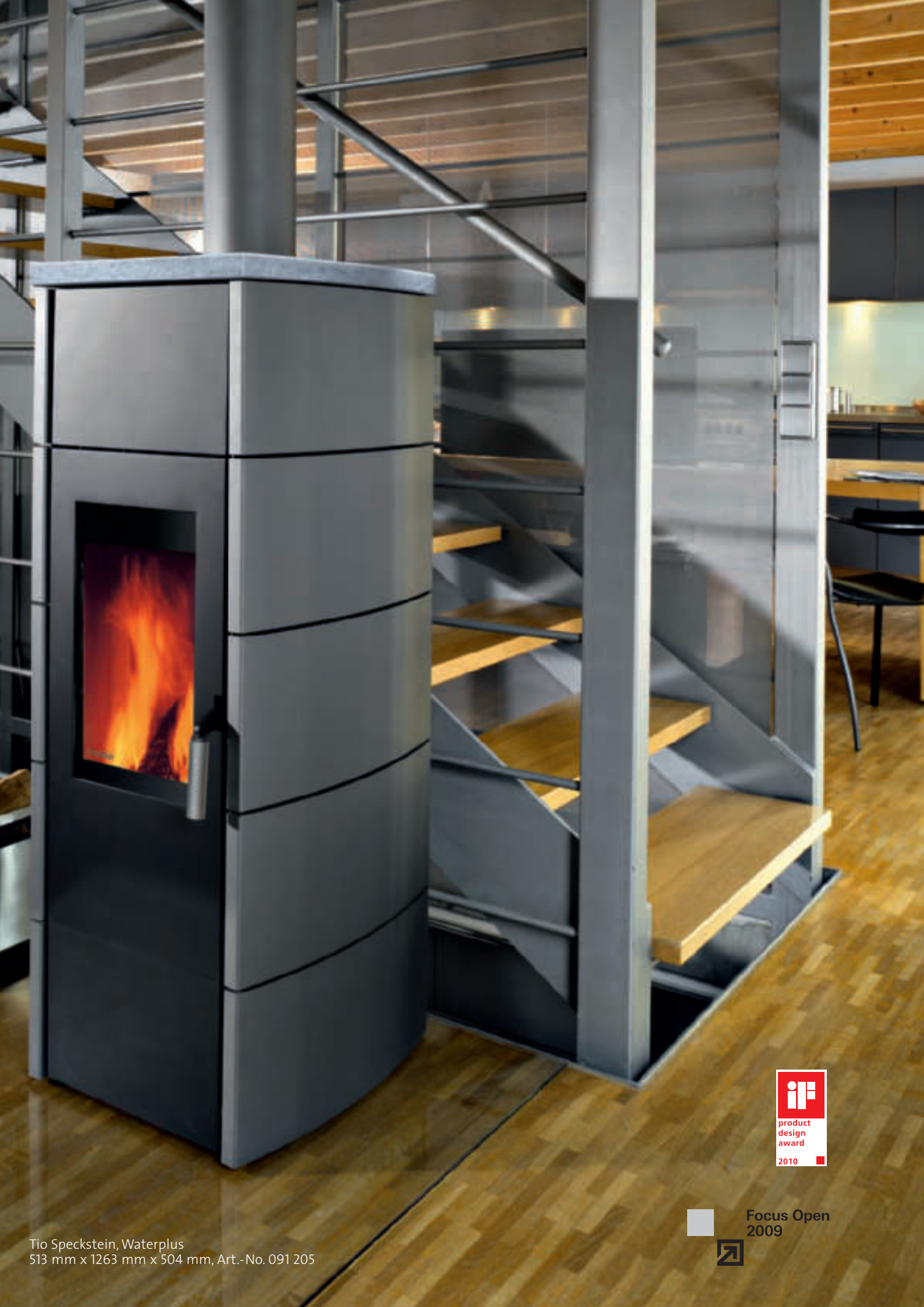
Tio Speckstein, Waterplus 513 mm x 1263 mm x 504 mm, Art.-No. 091 205