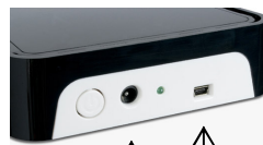
Power on/off ↑ Power supply ↑ USB port ↑