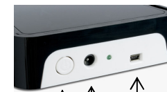
Marche/Arrêt ↑ Entrée d'alimentation ↑ Port USB ↑