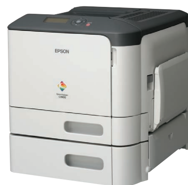
Bac supplémentaire de 500 feuilles en option pour accroître la capacité de papier jusqu'à 850 feuilles