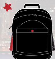
LATERAL NEOPRENE POCKET