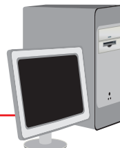
PC Serial Port