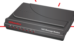
Model 5668D Message Modem