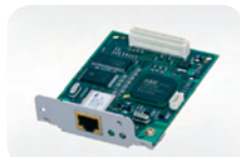
Réseau local sans fil