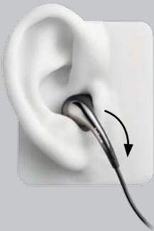
Ergonomie de l'écouteur droit

Le son exceptionnel d'un kit piéton dépend de la qualité des écouteurs et d'un port parfait et sécurisé. Les écouteurs sont conçus de manière ergonomique pour s'adapter précisément à votre oreille gauche ou à votre oreille droite. Pour un son et un confort optimaux, assurez-vous de placer chaque écouteur dans la bonne oreille.