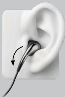
Ergonomie de l'écouteur gauche

* Varie en fonction du téléphone. Compatible avec l'iPhone™.