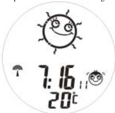
Snooze mode, the 3' in left & 3' in right turns on