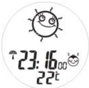
Alarm On, alarm on animation 1