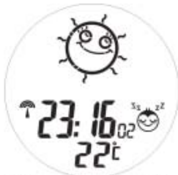
Alarm On, alarm on animation 2