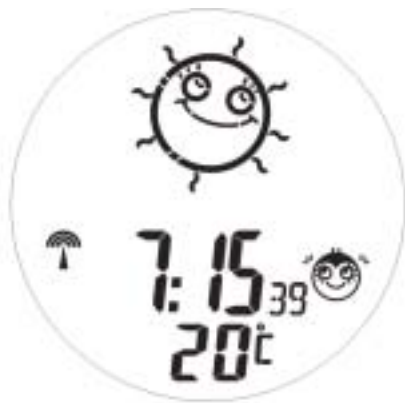
Alarm Activated animation 1