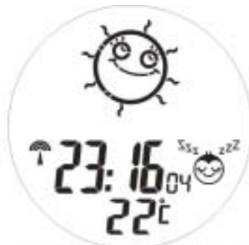
Alarm On, alarm on animation 3