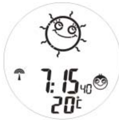
Alarm Activated animation 2

Alarm Activated (the 3' in left & 3' in right flash)