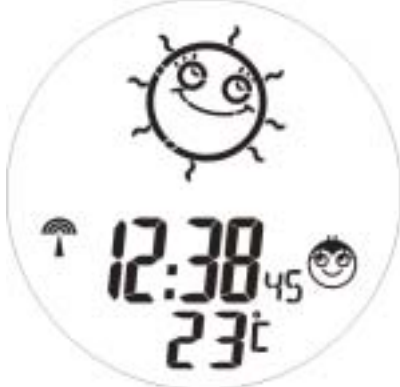
Alarm Off (Normal Mode)