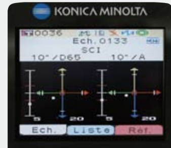
Graphique d'écart de couleur