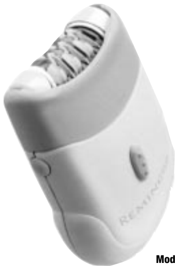
Model Number EP-1000 EP-2000

Please read this information before you use the Smooth & Silky® epilator. It will give you a better understanding of how the product works, and you'll be assured of enjoying maximum results.