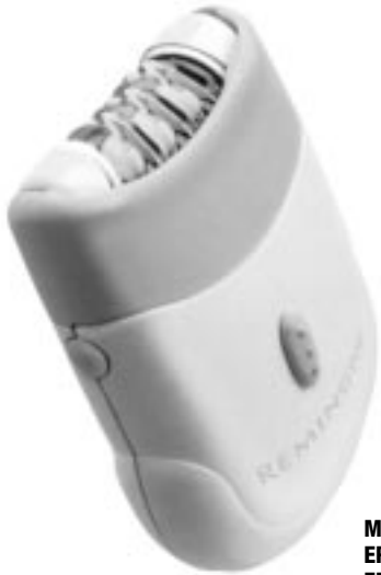
Modèle EP-1000 EP-2000

Veuillez lire ces renseignements avant d'utiliser Smooth & Silky ™ . Ils vous feront mieux comprendre comment l'appareil fonctionne et vous serez assurée d'obtenir les meilleurs résultats.