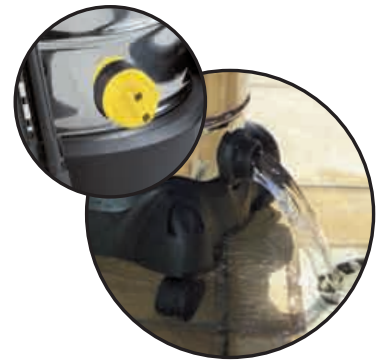
Vidange de cuve Draining tank