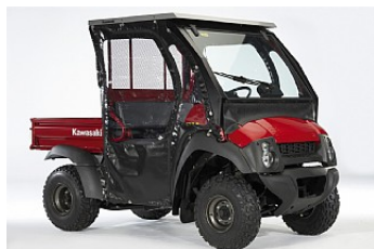
KIT CABINE DE BASE € 1 129,00