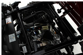
Moteur refroidi par air