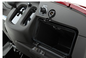
Boite à gants