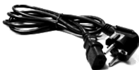
Un câble d'alimentation