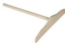
Un répartiteur en bois