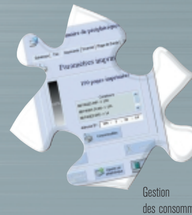
Gestion des consommables