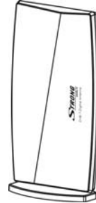
(V-Broadcast) antenne montée en V (Droit)