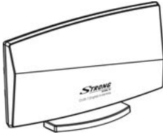
( H-Broadcast) antenne montée en H