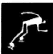
Patinage de vitesse