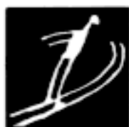
Saut au tremplin