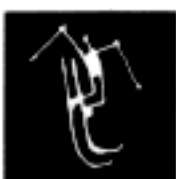
Style libre – Ski de bosse

Toutes les épreuves ont lieu dans et autour de l'actuel Lillehammer. Pour certaines épreuves, deux concurrents peuvent s'affronter simultanément à l'écran.