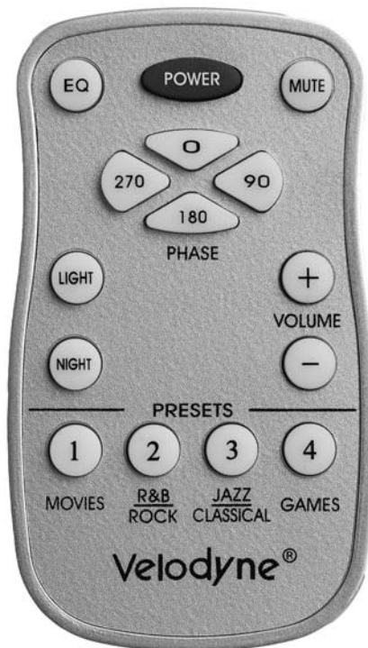
Figure 2. Télécommande

La figure 2 montre la télécommande qui vous permet de choisir le mode d'écoute que vous désirez.