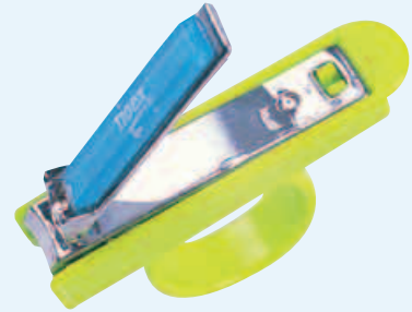
F Coupe-ongles ergonomique GB Nail clippers NL Ergonomische nagelknipper