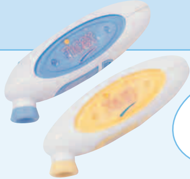
F Thermomètre frontal GB Head Thermometer NL Voorhoofdstermometer

> 3 couleurs (2 de chaque) > 3 colours (2 of each) > 3 kleuren (van elk 2)