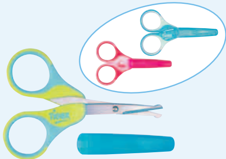
F Ciseaux spatulés avec étui GB Spatula scissors and case NL Spatelschaartje met etui

> (4 de chaque) > (4 of each) > (van elk 4)