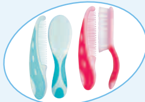
F Brosse et peigne GB Brush and comb set NL Borstel en kam

> (4 de chaque) > (4 of each) > (van elk 4)