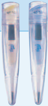
F Thermomètre électronique embout souple GB Electronic thermometer, soft-tipped NL Elektronische thermometer met soepel uiteinde