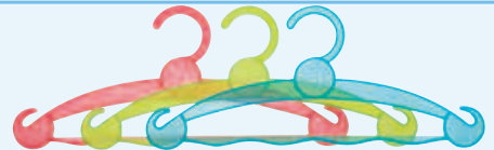
F Cintres plastiques GB Plastic hangers NL Plastic klerenhangertjes

> Cavalier ☞ x 12 (3 couleurs) > ☞ tab x 12 (3 colours) > ☞ met kram x 12 (3 kleuren)