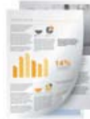
Insertion de documents