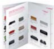
Agrafage à cheval