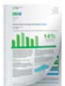
Perforation de qualité professionnelle*