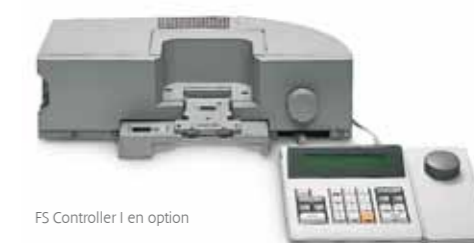
FS Controller I en option

* disponible uniquement avec l'option FS Controller I.