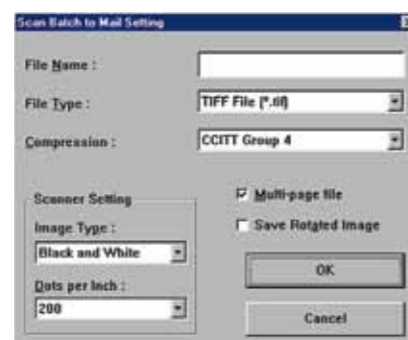
Scan Batch to Mail