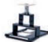
Fixation plafond LV-CL05