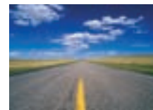
Correction numérique de trapèze