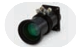
Objectif grand-angle IL02