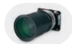
Zoom ultra-longues focales IL04