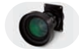
Objectif ultra-grand-angle IL01

Des objectifs optionnels permettent de configurer spécifiquement le LV-7555 en fonction de divers contextes d'utilisation : rétroprojection en salle d'exposition, dans un petit théâtre, etc. Objectif ultra-grand-angle, objectif grand-angle, un zoom longues focales ou le tout récent zoom ultra-longues focales, tous bénéficient de l'incomparable expérience de Canon dans le domaine de l'optique et se caractérisent donc par une faible distorsion d'image et une reproduction fidèle des couleurs.