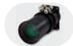
Zoom longues focales IL03