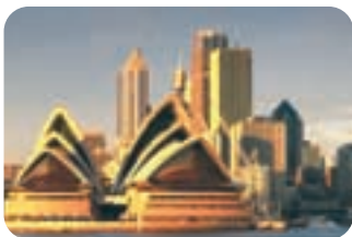
Précision et contrôle des couleurs

Bénéficiez de projections lumineuses et nettes dans toutes les conditions. Le LV-7555 utilise le système exclusif Canon "Turbo Bright System" (système de luminosité turbo) pour porter la puissance de luminosité de 4.000 ANSI lumens à l'incroyable valeur de 4.600 ANSI lumens. Ceci en fait le projecteur le plus lumineux de sa catégorie. Cette puissance inédite permet d'obtenir des images très nettes même en projection dans des lieux éclairés. La résolution XGA est optimisée par un exceptionnel ratio de contraste de 900:1 assurant des couleurs franches et saturées.