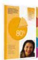
Impression avec onglets