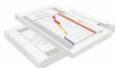
Regroupement et assemblage