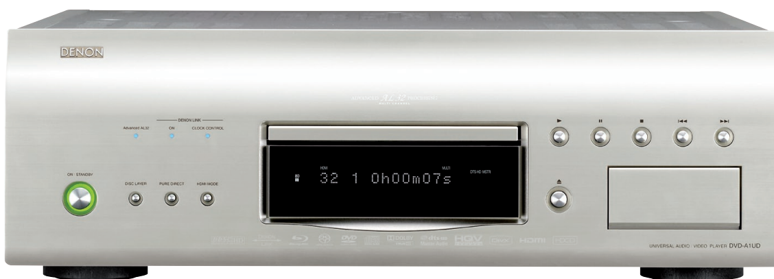
Finition Premium Silver

Le DVD-A1UD est le lecteur universel le plus évolué dans la gamme DENON. Il lit non seulement les disques Blu-ray, mais tous les autres formats de disques que vous possédez dans votre collection : DVD Vidéo, DVD Audio, SACD, et bien sûr CD, avec l'impeccable qualité d'image et de son qu'on attend d'un support numérique.