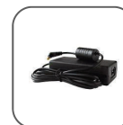
Kit adaptateur AC