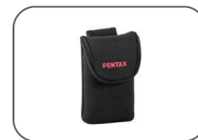
Étui en néoprène