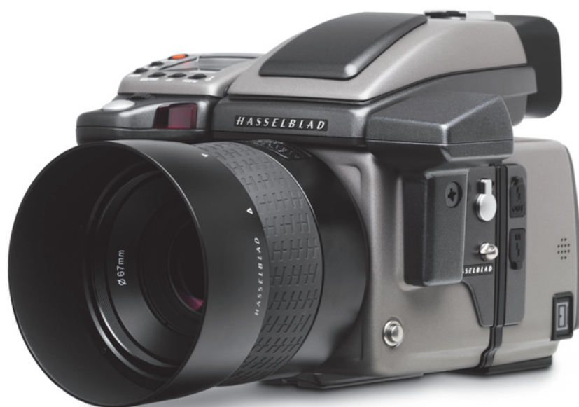
H3DII avec dispositif d'enregistrement GIL GPS.