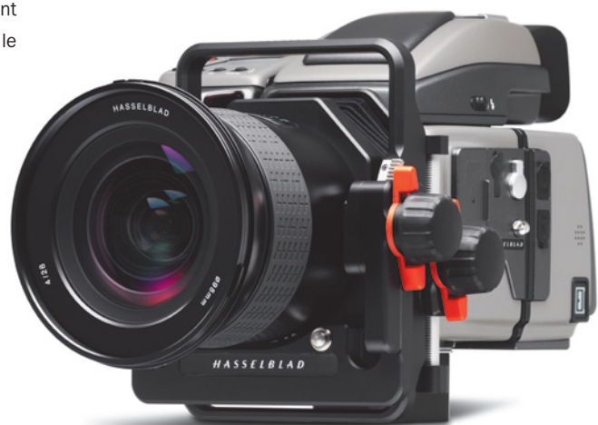
H3DII avec adaptateur HTS 1.5 tilt/shift et objectif HCD 28 mm.

Pour plus d'informations, voir la fiche technique H3DII-39MS correspondant à chaque produit.