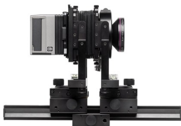
Dos CF monté sur chambre photographique via un i-Adapter.

La gamme de dos Hasselblad CF apporte une nouvelle souplesse aux professionnels de la photographie numérique, avec deux capteurs (22 ou 33 millions de pixels) et trois options de stockage: la carte CF pour un maximum de portabilité, la banque d'images de 100 Go pour des enregistrements ultra-rapides, ou la connexion câblée à un PC pour un maximum de contrôle des images. Associée à l'interface ouverte i-Adapter Hasselblad, la gamme CF s'utilise avec une vaste gamme d'appareils, pour obtenir le nec plus ultra de la prise de vue avec votre plate-forme photographique préférée. Les dos numériques CF, qui permettent des prises de vues multiples en couleurs réelles, offrent la qualité d'image Star, qui étend considérablement les horizons de la photographie numérique.