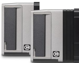
CF 39 et CF 39MS

Dotés de capteurs deux fois plus grands que les plus grands capteurs 35mm, les dos numériques offrent une résolution supérieure, avec moins de bruit et des possibilités de composition étendues. Résultat: un nombre plus élevé de pixels plus grands, ce qui garantit une qualité supérieure en termes de fidélité des couleurs, avec absence de moiré et dégradés continus, même en faibles conditions de luminosité. Avec la version 4*Res disponible en option, vous pouvez quadrupler la résolution de vos prises de vues.