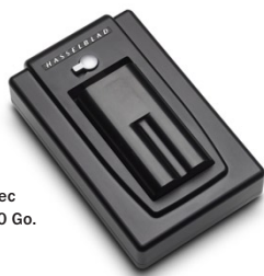
Stockage ultrarapide avec banque d'images de 100 Go.

Les dos CF vous offrent toute la flexibilité dont vous avez besoin, grâce à trois modes de stockage: la carte CF pour un maximum de portabilité, la banque d'images de 100 Go pour des enregistrements ultra-rapides, ou la connexion à un PC pour un maximum de contrôle des images.