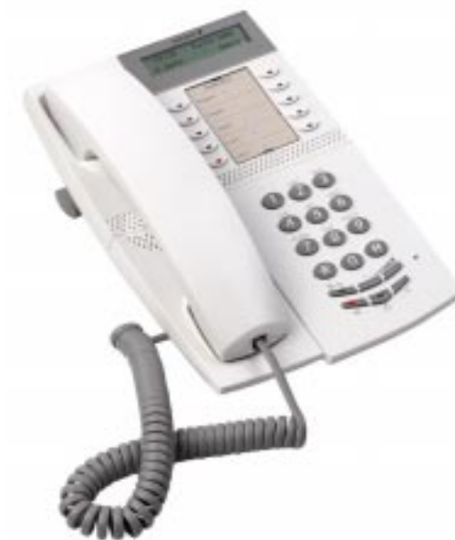
MD Evolution System telephone