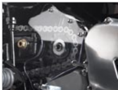
CARTER PSB EN POLYCARBONATE A9618037