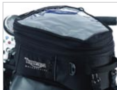
SACOCHÉ DE RÉSERVOIR A9510006 Capacité - 12 litres extensible à 20 litres