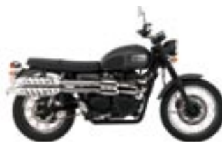
SCRAMBLER Jet Black