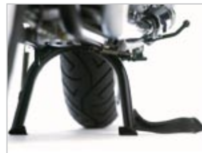
KIT BÉQUILLE CENTRALE A9758008 Uniquement pour Bonneville T100