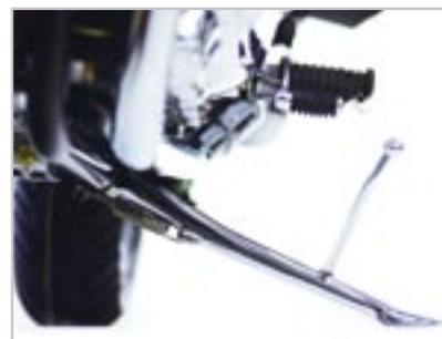
BÉQUILLE LATÉRALE - CHROMÉE A9738039 Uniquement pour Bonneville T100