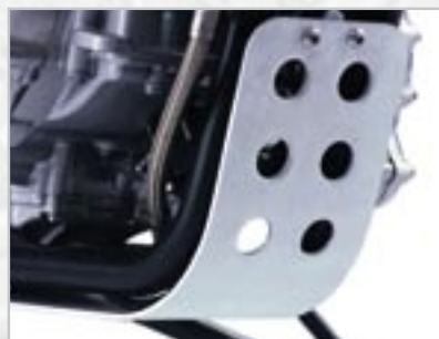
SABOT MOTEUR ANODISE A9708044