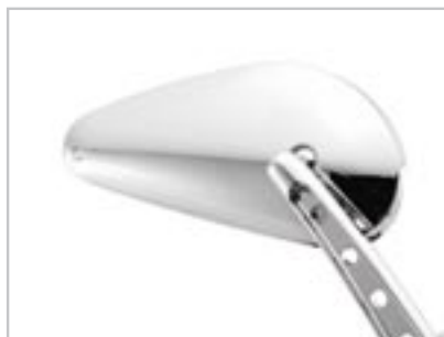
RÉTROVISEURS GOUTTE D'EAU A9638033 - Branches pleines A9638034 - Branches ajourées