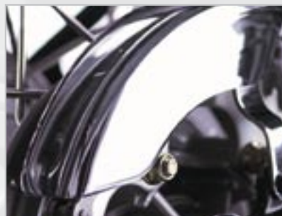
PARE-CHAÎNE - CHROMÉ A9738035