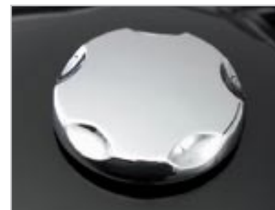
BOUCHON DE RÉSERVOIR A9730176