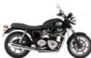
BONNEVILLE SE Jet Black