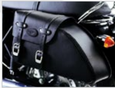
SACOCES EN CUIR BISEAUTÉES A9528027