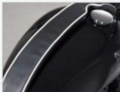
PROTÈGE RÉSERVOIR A9708104 - Ivoire A9708102 - Rouge A9708103 - Jaune