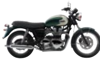
T100 Forest Green et New England White