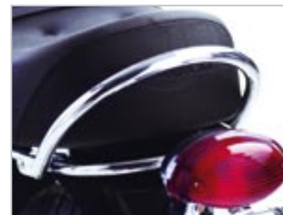
POIGNÉE PASSAGER - CHROMÉE A9738017