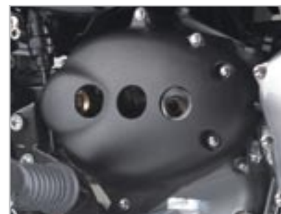
CARTER PSB PERCÉ - NOIR A9618085