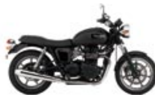
BONNEVILLE Jet Black