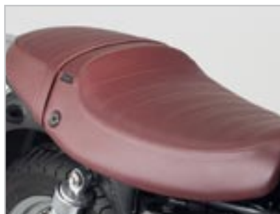
SELLE COMTEMPORAINE A9700138