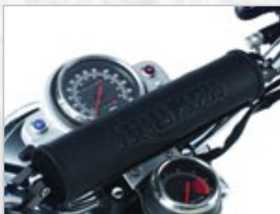
GUIDON RENFORCÉ A9638008