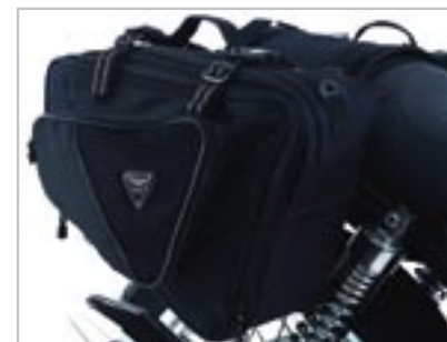
KIT SACOCHE SPORT A9518013 Capacité - 12 litres extensible à 20 litres par sacoches