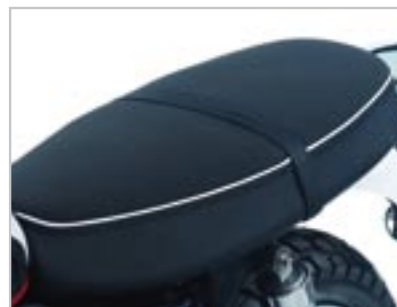
SELLE GEL A9700136