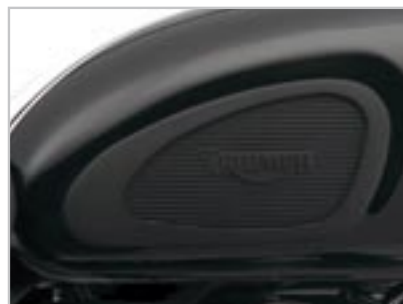
PROTÈGE GENOUX A9718009