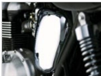
CARTER LATÉRAL - CHROMÉ A9738060