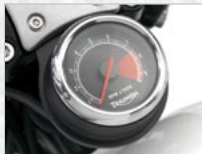
KIT COMPTE TOUR A9938001