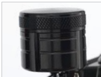
RÉSERVOIR DE LIQUIDE DE FREIN ANODISE – AVANT A9628016 Uniquement pour Bonneville et Bonneville SE