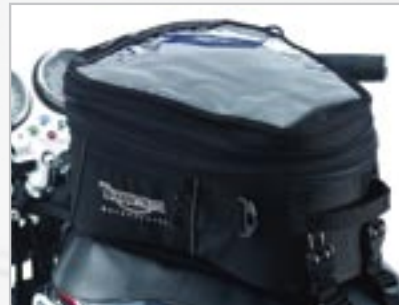
SACOCHÉ DE RÉSERVOIR A9510006 Capacité - 12 litres extensible à 20 litres