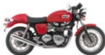
THRUXTON Tornado Red et White Stripe