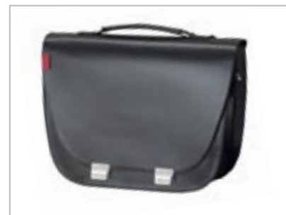
SACOCHE CITY A9528021 - Noir Gauche A9528024 - Marron Gauche