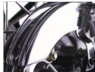
PARE-CHAÎNE - CHROMÉ A9738035