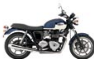
BONNEVILLE SE Pacific Blue et Fusion White