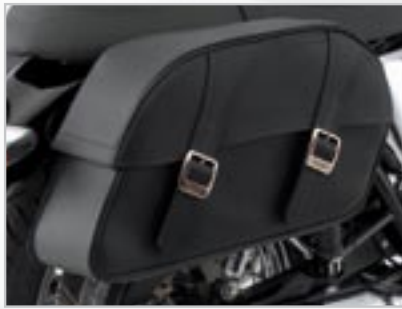
SACOCES EN CUIR - CLASSIC A9528028