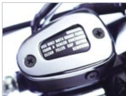
COUVRE MAITRE CYLINDRE CHROMÉ A9738061 Uniquement pour Bonneville T100