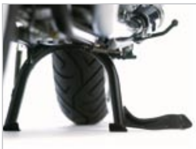
BÉQUILLE CENTRALE A9758013