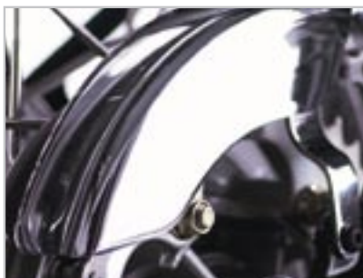
PARE-CHAINE - CHROMÉ A9738035