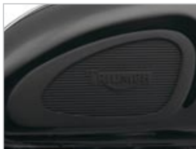
PROTÈGE GENOUX A9718009