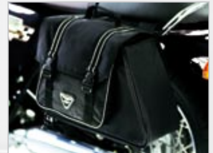
SACOCES NYLON A9518025 Capacité - 12 litres par sacoches