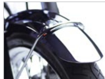
GARDE BOUE AV- CHROMÉ A9730054 Uniquement pour Bonneville T100