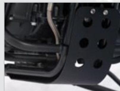
SABOT MOTEUR ANODISE - NOIR A9708190