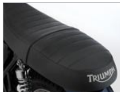
SELLE EN ALCANTARA – NOIR A9701208 Complete with Rain Cover