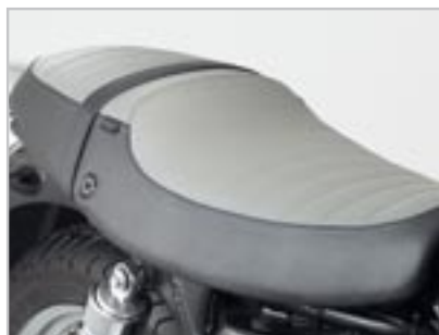
SELLE COMTEMPORAINE Noir / Gris A9700137