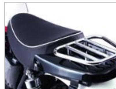
SELLE MONO ET PORTE-PAQUET A9708096 - Passepoil blanc A9708097 - Passepoil Noir