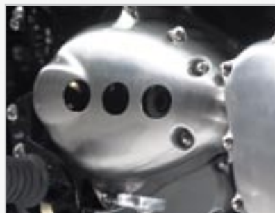
CARTER PSB PERCÉ - CHROMÉ A9738160