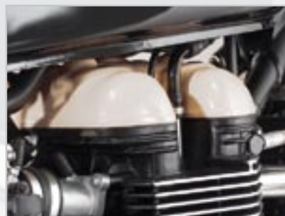
COUVRE CULASSE PEINT A9618038-NE - Ivoire A9618038-CM - Rouge A9618038-FA - Jaune