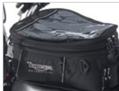
SACOCHE DE RÉSERVOIR A9510006 No se monte pas avec le kit compte tours A9938001