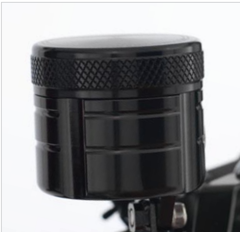
RÉSERVOIR DE LIQUIDE DE FREIN ANODISÉ – AVANT A9628016