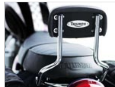
SISSY BAR HAUT - CHROMÉ A9738018