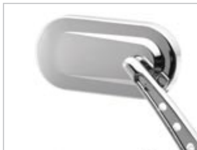
RÉTROVISEURS OVALES A9638032 - Branches pleines A9638031 - Branches ajourées Pour Bonneville T100 uniquement