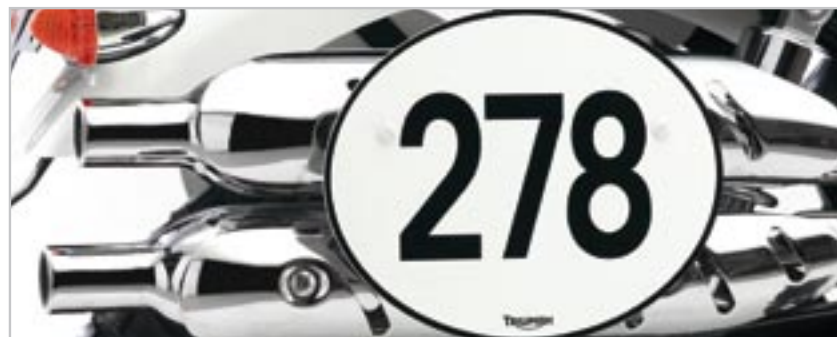
PLAQUE NUMÉRO A9708039 Ne se monte pas avec les silencieux Arrow Les numéros ne sont pas inclus