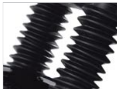
SOUFFLETS DE FOURCHE A9638018 Uniquement pour Bonneville et Bonneville SE