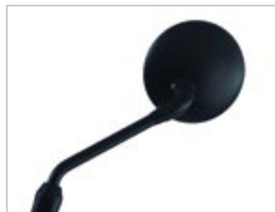
RÉTROVISEUR NOIR A9638012