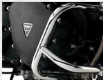
BARRES DE PROTECTION MOTEUR - CHROMÉ A9758015