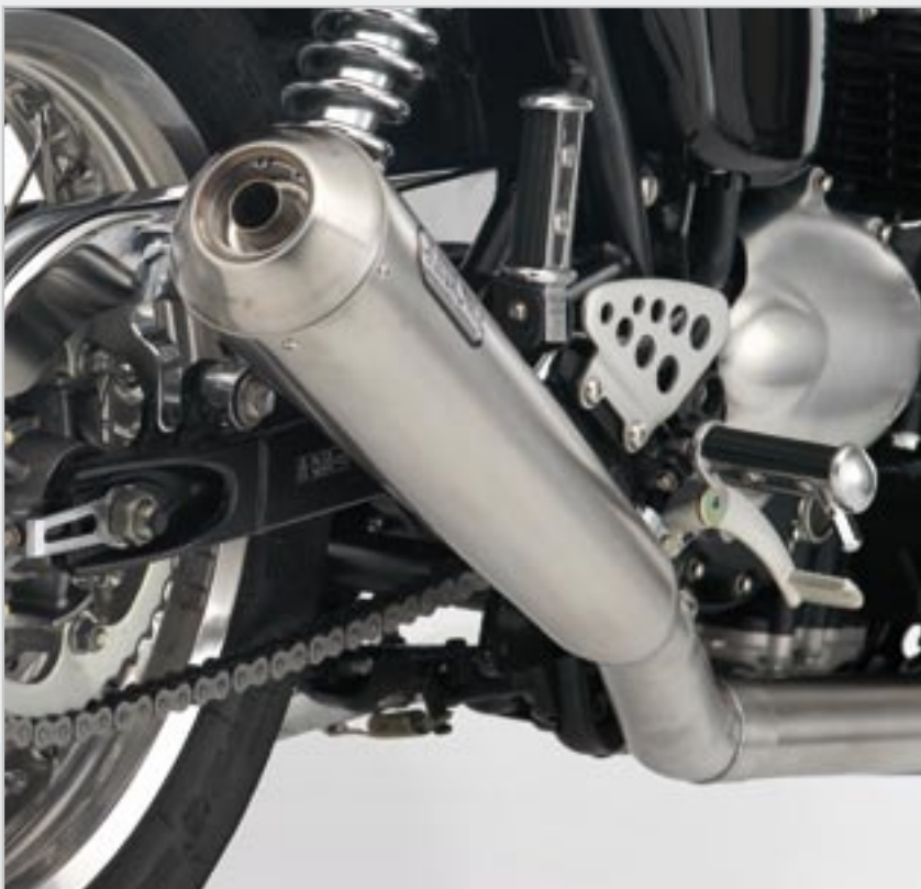
SILENCIEUX ARROW HOMOLOGUÉ 2/1* A9600053