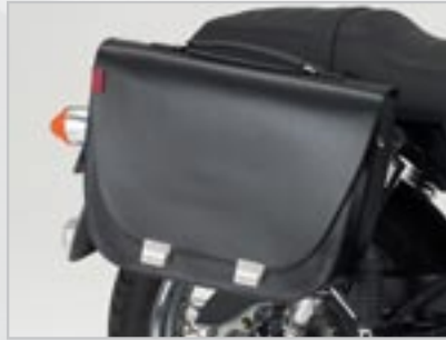
SACOCHÉ CITY A9528020 - Noir la Paire A9528021 - Noir Gauche A9528022 - Noire Droite