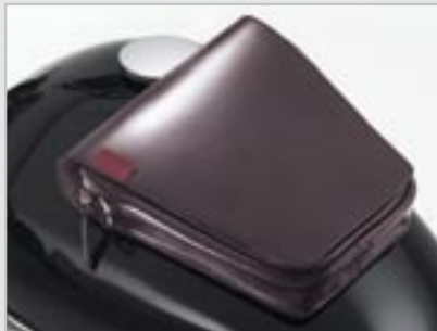
SACOCHÉ RÉSERVOIR MAGNÉTIQUE - MARRON A9528003