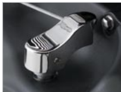
CACHE BRAS D'EMBRAYAGE- CHROMÉ A9738075