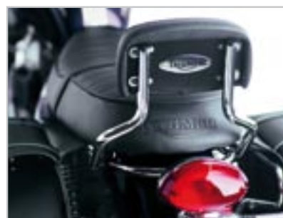
SISSY BAR - CHROMÉ A9738019 - Bas A9738018 - Haut