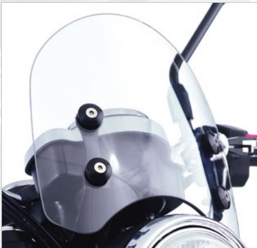
TÊTE DE FOURCHE - TRANSPARENT A9708049