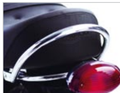
POIGNÉE PASSAGER - CHROMÉE A9738017