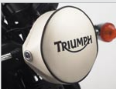
COUVRE PHARE A9708107 - Ivoire A9708105 - Rouge A9708106 - Jaune