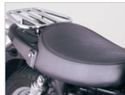
SELLE MONO ET PORTE-PAQUET A9708097