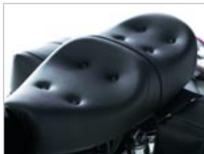
SELLE KING & QUEEN A9700133