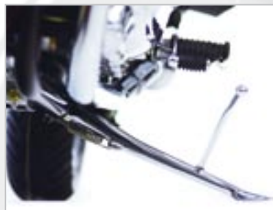
BÉQUILLE DE STAND - CHROMÉE A9730019