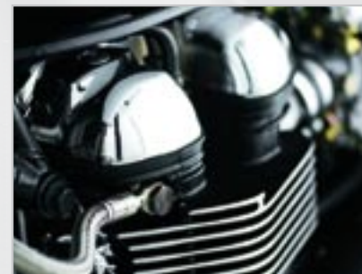
COUVRE CULASSE - CHROMÉ A9738034