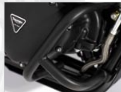
BARRES DE PROTECTION MOTEUR - NOIR A9758025