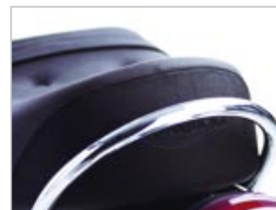
POIGNÉE PASSAGER - CHROMÉE A9738017

*Veuillez-vous référer au dos du catalogue pour plus d'informations