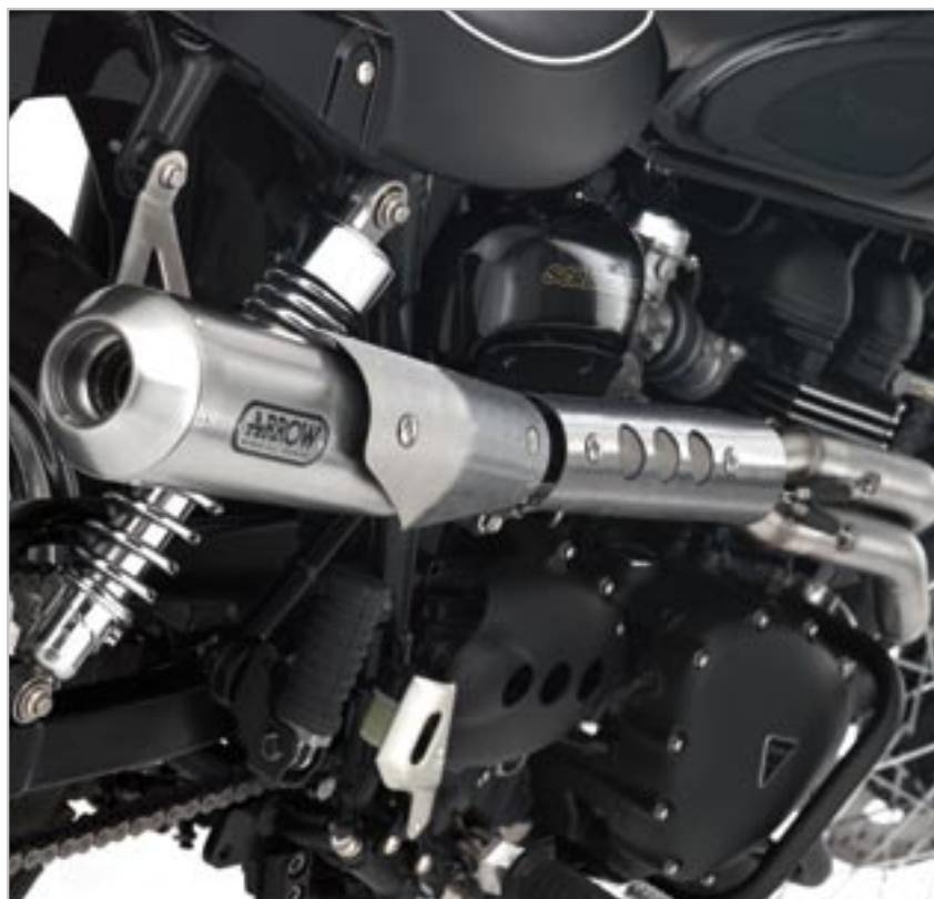
SILENCIEUX ARROW HOMOLOGUÉ* A9600094