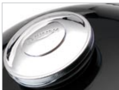
BOUCHON DE RÉSERVOIR À CLÉS A9930170