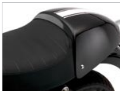
SELLE GEL TOURING - DUO A9700135