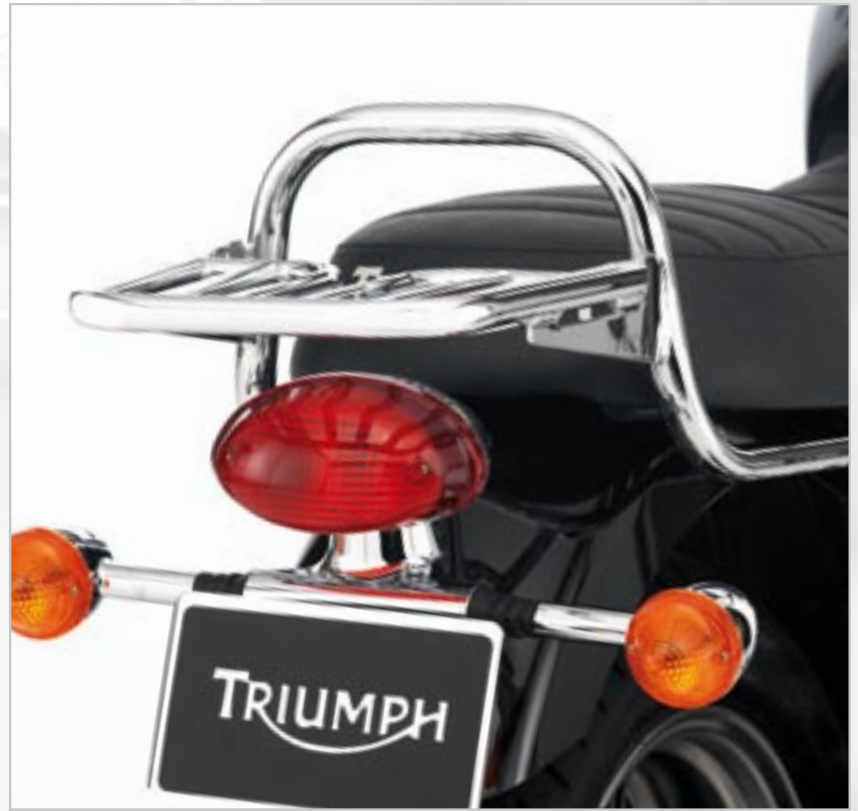
PORTE PAQUET - CHROMÉ A9738191