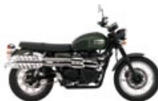
SCRAMBLER Matt Khaki Green