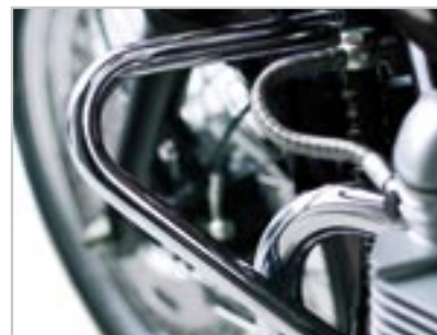
BARRES DE PROTECTION MOTEUR - CHROMÉ A9758048