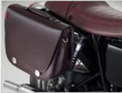
SACOCHÉ CITY A9528023 - Marron la Paire A9528024 - Marron Gauche A9528025 - Marron Droite