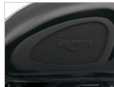
PROTÈGE GENOUX A9718009