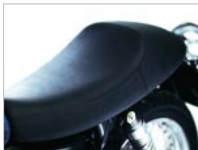
SELLE MONO A9700134