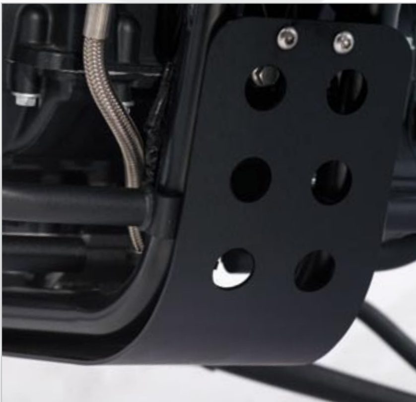
SABOT MOTEUR ANODISE NOIR A9708190