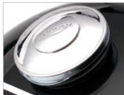
BOUCHON DE RÉSERVOIR À CLÉS A9930170