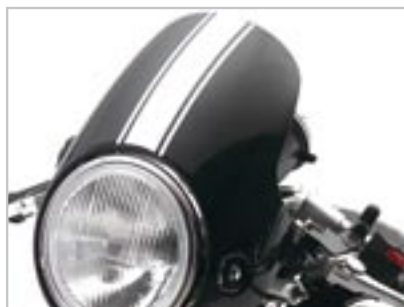
TÊTE DE FOURCHE A9748069-## - Bande blanche A9748070-## - Bande rouge A9748071-## - Bande or