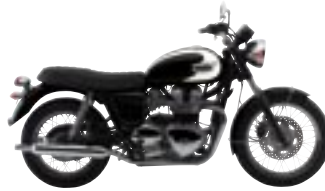
T100 Jet Black et Fusion White