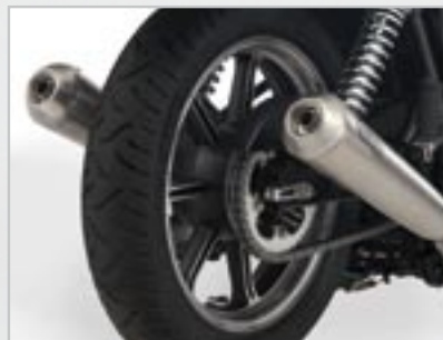
SILENCIEUX ARROW HOMOLOGUÉ 2/2* A9600075