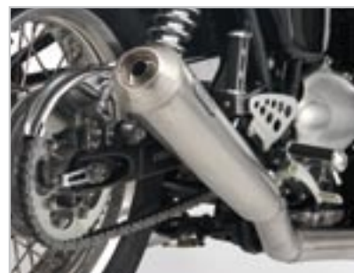
SILENCIEUX ARROW HOMOLOGUÉ 2/1* A9600053