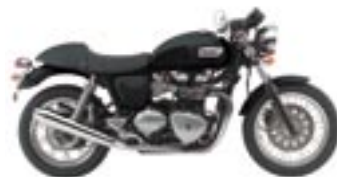
THRUXTON Jet Black et Gold Stripe