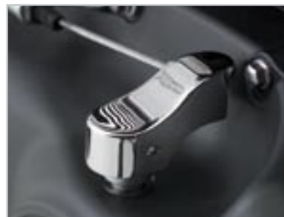
CACHE BRAS D'EMBRAYAGE- CHROMÉ A9738075