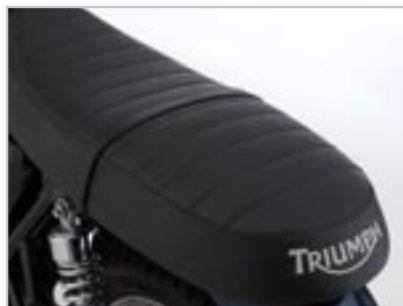
SELLE GEL CONFORT A9700246