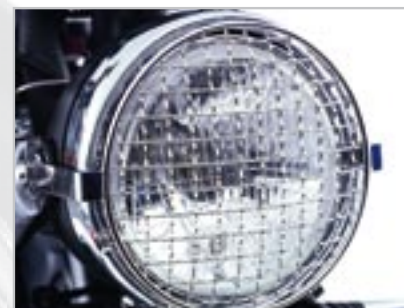
GRILLE DE PHARE A9758024