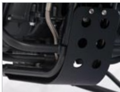
SABOT MOTEUR - ANODISÉ NOIR A9708190