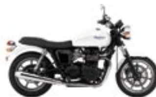
BONNEVILLE Fusion White