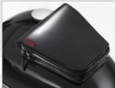
SACOCHÉ RÉSERVOIR MAGNÉTIQUE - NOIR A9528002