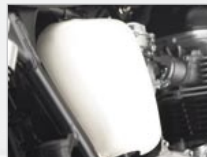
CARTER LATÉRAL PEINT A9708077-NE - Ivoire A9708077-CM - Rouge A9708077-FA - Jaune