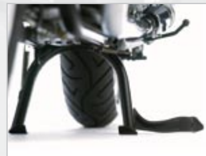
KIT BÉQUILLE CENTRALE A9758100