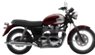
T100 Claret et Aluminium Silver