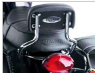
SISSY BAR BAS - CHROMÉ A9738019 Ne se monte pas avec la selle King & Queen, A9700133