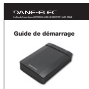
Guide de démarrage