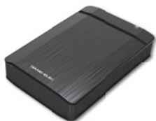
Disque dur externe