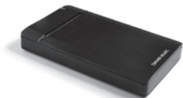
Disque SSD externe