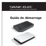
Guide de démarrage