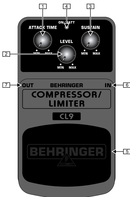
Vue d'en haut