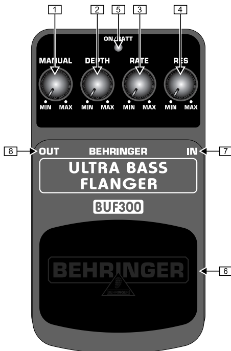
Vue d'en haut