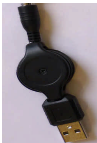
Cordon enrouleur USB porte embout

Pour obtenir d'autres connectiques non livrées dans ce produit, consultez notre site internet: