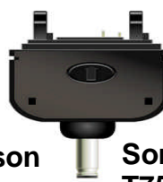
Sony Ericsson T750