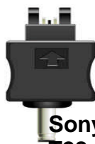
Sony Ericsson T28