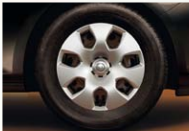
Jantes en acier avec enjoliveur, 7 J x 17, pneus 215 (225)/50 R 17 (PWP). De série sur Enjoy en combinaison avec FlexRide ou châssis sportif surbaissé.