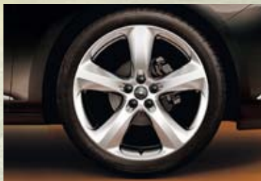
Jantes en alliage, 8 J x 19, 5 branches, pneus 235/40 R 19 (PZS). En option sur Enjoy, Sport et Cosmo.