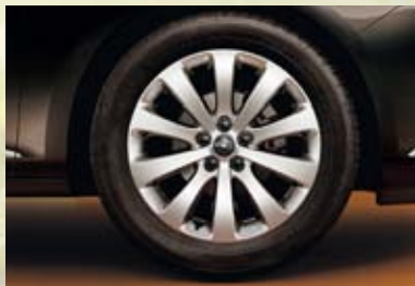
Jantes en alliage, 7 J x 17, 10 branches, pneus 215 (225)/50 R 17 (PGQ). De série sur Cosmo, en option sur Enjoy.