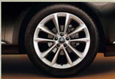
Jantes en alliage, 7,5 J x 18 et 8 J x 18, 5 doubles branches, pneus 225/45 R 18 ou 235/45 R 18 (PZW/PZK). En option sur Enjoy, Sport et Cosmo.