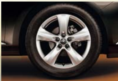
Jantes en alliage, 7 J x 17, 5 branches, pneus 215 (225)/50 R 17 (PWX). De série sur Sport, en option sur Enjoy.