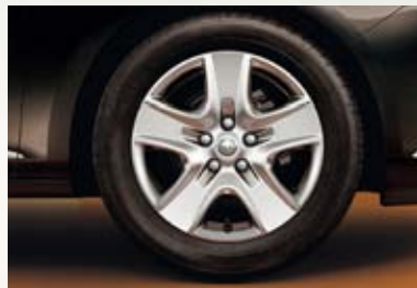
Jantes design, 7 J x 17, 5 branches, pneus 215 (225)/50 R 17 (PWT). En option sur Enjoy.