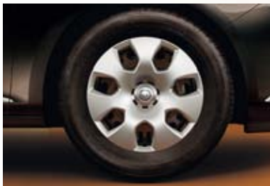
Jantes en acier avec enjoliveur, 6,5 J x 16, pneus 205 (215)/60 R 16 (PWM). De série sur Essentia et Enjoy.