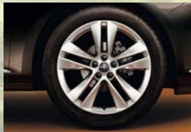
Jantes en alliage, 7,5 J x 18 et 8 J x 18, 5 doubles branches, pneus 225/45 R 18 ou 235/45 R 18 (PZV/PZJ). En option sur Enjoy, Sport et Cosmo.