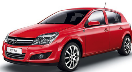
▲ Power Red