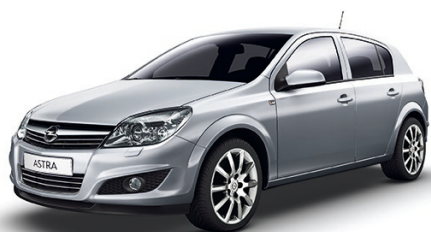
▲ Silver Lightning