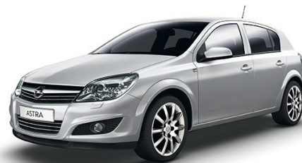
▲ Sovereign Silver