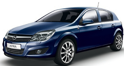
▲ Royal Blue