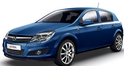
▲ Ultra Blue