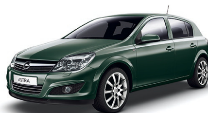
▲ Myth Green