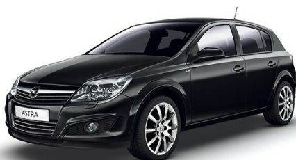
▲ Black Sapphire