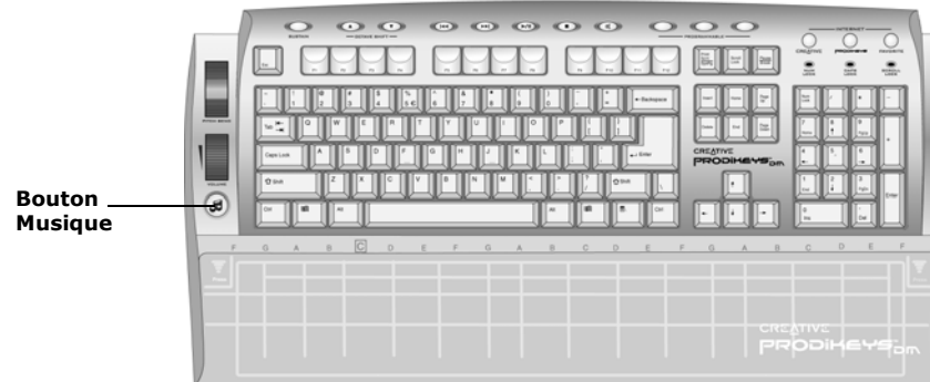
Figure 3-1: Clavier Creative Prodikeys DM.

Pour démarrer le logiciel : Appuyez sur le bouton Musique du clavier Creative Prodikeys DM.