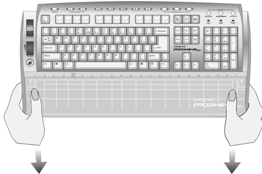
Figure 1-2: Retrait du repose-poignets

Pour retirer le repose-poignets: Appuyez sur les angles supérieurs de la protection et faites-la glisser, comme illustré ci-dessous.