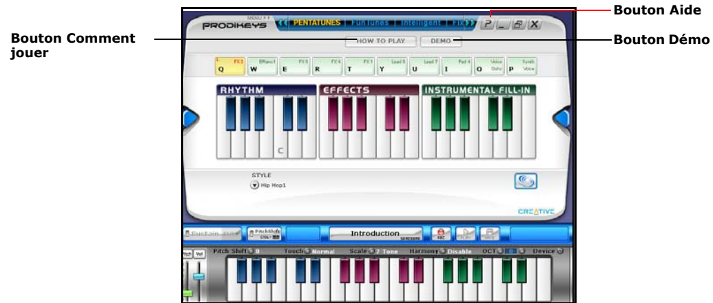
Figure 3-2: Ecran de démarrage du logiciel Creative Prodikeys DM – mode Mélodies Penta

Après le démarrage du logiciel, un écran similaire à la Figure 3-2 doit s'afficher.