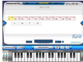
Mode Accord fixe