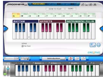
Mode Mélodies Penta

Les six modes de lecture différents du logiciel Prodikeys DM vous permettent de vous amuser tout en jouant et en apprenant la musique. Appuyez sur le bouton Comment jouer dans chaque mode pour plus d'informations.