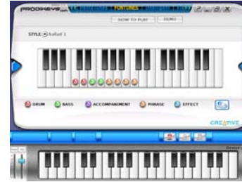
Mode Mélodies Fun