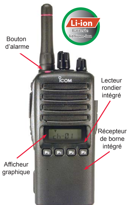
Modèle sans clavier présenté avec antenne courte