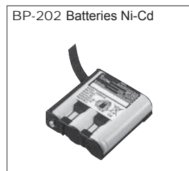
BP-202 Batteries Ni-Cd Batterie à installer dans le portatif. 3,6 V / 700 mAh