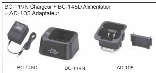
BC-119N Chargeur + BC-145D Alimentation + AD-105 Adaptateur Chargeur rapide Ni-Cd pour la charge des batteries BP-202 seule ou avec le portatif. Temps de charge: 75 à 85 min.