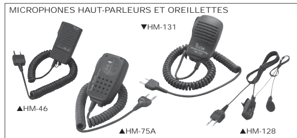
MICROPHONES HAUT-PARLEURS ET OREILLETES BC-10N : Chargeur rapide 2 postes livré avec alimentation 220 V et câble allume cigare BC-121N : Multi-chargeur rapide (à utiliser avec 6 AD-105 et 1 BC-157) BC-157 : Alimentation pour BC-121N EP-OT1FB : Oreillette discrète EP-OT2FN : Ecoute discrète mic/PTT déporté EP-OT3FN : Ecoute discrète mic et PTT déporté EP-SAT01 : Micro oreillette haute résistance EP-SHC300S : Oreillette avec tour d'oreille HM-46 : Microphone haut-parleur miniature