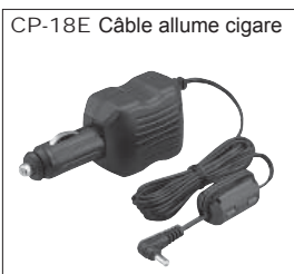
CP-18E Câble allume cigare 6 V, 2 A à partir du 12 V (avec convertisseur international DC-DC).