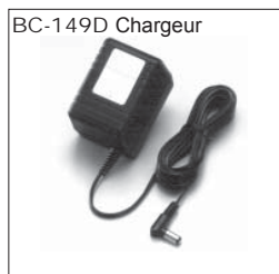
BC-149D Chargeur Permet de charger la batterie BP-202 même pendant l'utilisation. (6 V, 1 A)