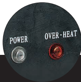
Protection thermique Over heat protection