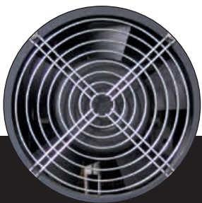
Turbo ventilé Turbo fan