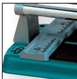
Réglet gradué Graduated ruler