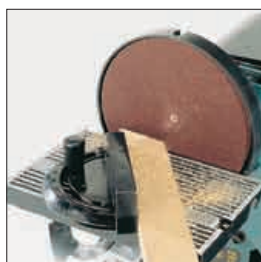
Guide d'angle et table inclinable Miter gauge and tilting table.

Bras inclinable de 0 à 90° 0 to 90° arm tilting