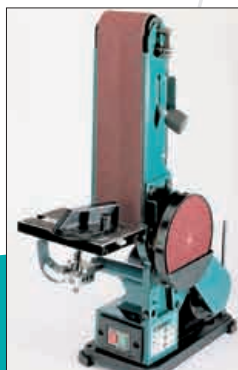
Bras inclinable pour formes difficiles Tilting arm for difficult shapes.