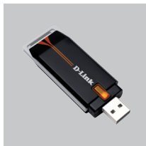
DWA-110 CLÉ USB WIRELESS G

Si l'un des éléments ci-dessous est manquant, veuillez contacter votre revendeur.