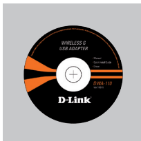
CD-ROM (Manuel, logiciel, et garantie sur CD)