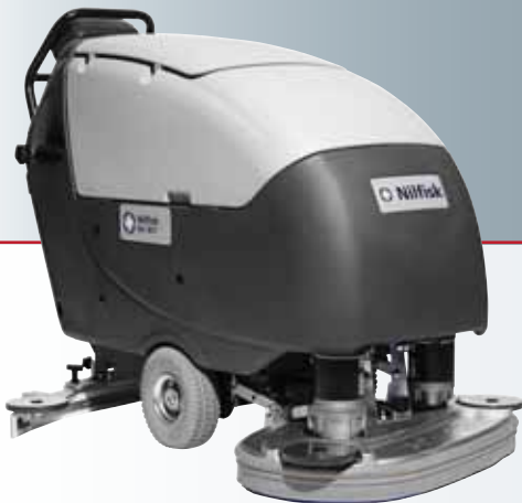
Nilfisk BA 851

Jamais un matériel n'a offert une telle combinaison de design ergonomique moderne, de performance élevée et de traction exceptionnelle. Il s'agit de laveuses accompagnées complètes pour le nettoyage de grandes surfaces.