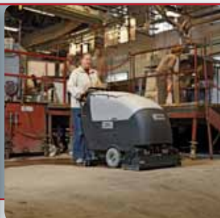
La gamme de laveuses BA 651/751/851 est conçue pour un nettoyage optimal des grandes surfaces au sol comme dans les supermarchés, les hôpitaux et les sols industriels