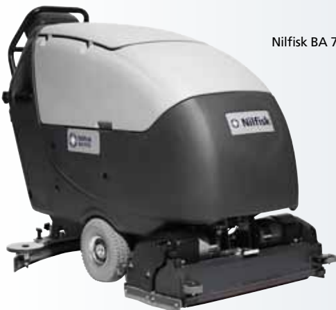
Nilfisk BA 751C

Le panneau de commande intuitif est facile à utiliser. Il réduit le risque d'erreur pour l'opérateur pour plus de sécurité et de meilleurs résultats