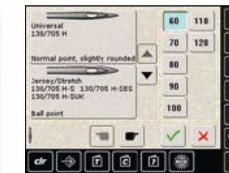
Tableau des aiguilles : l'aiguille fixée peut se choisir sur un tableau intégré et s'affiche à la mise sous tension de la machine BERNINA 820. L'aide fûtée qui vous permet de vous concentrer sur l'essentiel.

Tapering : mariez votre créativité aux nouvelles techniques. Le Tapering modifie en pointe le début et la fin d'un motif de point en quatre angles de base. La créativité dans tous ses états.