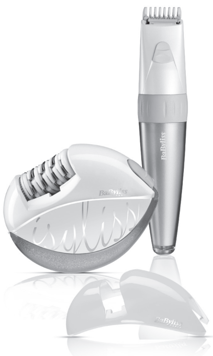
Épilateur compact • accessoire zones sensibles tondeuse bikini Compact epilator • sensitive area attachment bikini trimmer