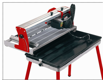
Bac de récupération d'eau avec pompe intégrée pour liquide de refroidissement