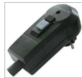
Interrupteur pour une sécurité optimale