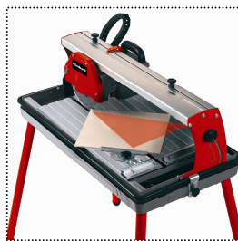
Butée d'angle réglable pour coupes précises