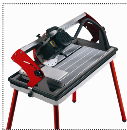
Guide du moteur inclinable en continu de 0° à 45°