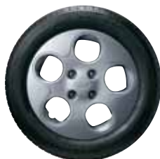
Jantes acier 14" avec pneumatiques 165/60 R14