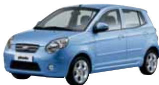
Bleu Diamant (L6)