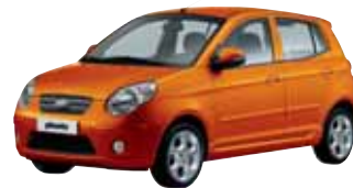
Orange Tonic (IZ) *