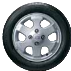
Jantes alliage 14" avec pneumatiques 165/60 R14 (option Pack Design sur version 1,1 essence)