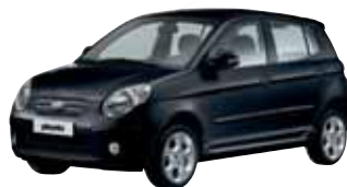
Noir Galaxy (Z1)

** Couleurs de carrosserie non-métallisées