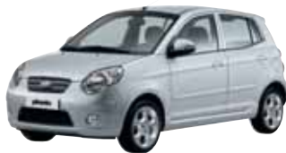
Gris Acier (3D)