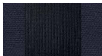
Intérieur tissu noir