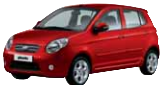
Rouge Scarlet (P9) **