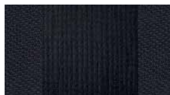
Intérieur « intégrale » tissu noir