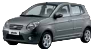
Gris Titane (IM) *