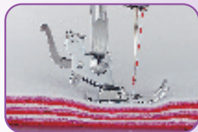
Couture dans les tissus épais grâce à la double hauteur du pied de biche et à la puissance de piquê