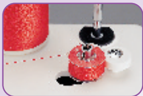
Débrayage automatique de la canette