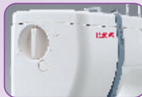
Pression du pied de biche réglable : Permet un entraînement régulier des tissus épais ou très fins et des tissus extensibles