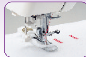
Boutonnière automatique en une phase à la taille du bouton, installez le à l'arrière du pied et réalisez une boutonnière impeccable en une seule opération