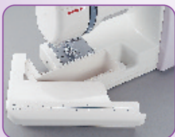
Table de couture avec les indications en inch et cm