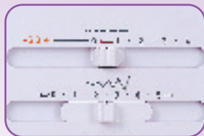
Réglage longueur et largeur des points