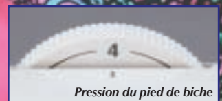
Pression du pied de biche