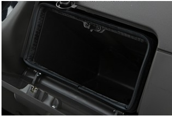
Boite à gants