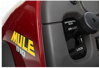
Double mode de différentiel