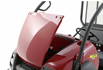
Rangements avant et arrière