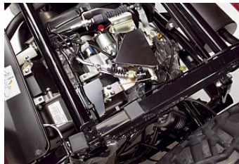
Moteur à refroidissement à air